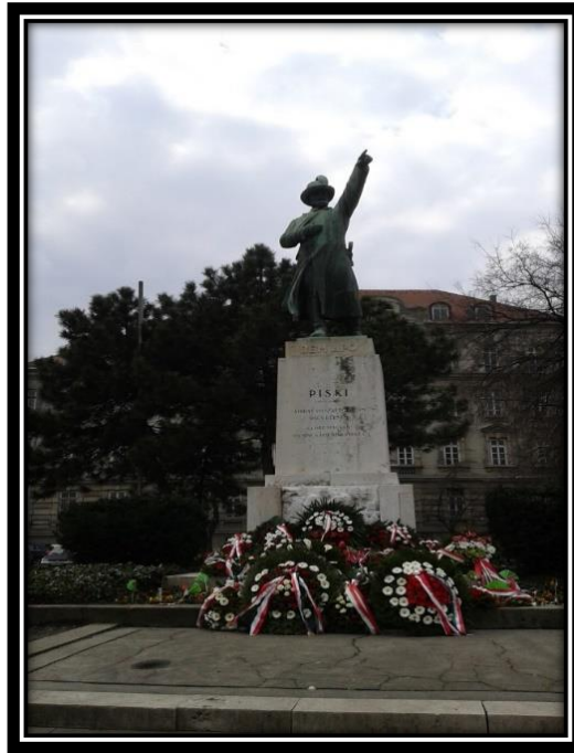
Pomnik gen. Józefa Bema w Budapeszcie

I to gen. Józef Bem otrzymał miano bohatera narodowego, odnosząc aż 33 zwycięstwa nad Austriakami. Jednak w 1849r. poniósł klęskę w bitwie pod Segesvárem. W wierszu Armia Siedmiogrodzka autor- SándorPetőfi gloryfikuje postać dowódcy, pisząc: