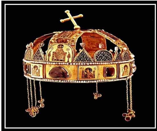
Korona świętego Stefana, którą można podziwiać w gmachu budapeszteńskiego Parlamentu.

Zarówno Polska jak i Węgry czerpały wzorce głównie z Europy zachodniej i południowej. Z kronik Galla Anonima możemy dowiedzieć się, że Bolesław Krzywousty i Koloman Uczony podpisali w 1086 roku sojusz obronny, zawierając tym samym szyki przeciwko wspólnemu wrogowi. Skutkiem tego sojuszu była m.in. pomoc udzielona Węgrom podczas ataku cesarza niemieckiego. Kolejnym ogniwem spajającym Polskę i Węgry było małżeństwo zawarte pomiędzy Elżbietą Łokietkówną, a pierwszym Andegawenem na węgierskim tronie – Karolem Robertem. Węgrzy wielokrotnie pomagali w tamtym okresie Polakom odpierać ataki nieprzyjaciół np. podczas konfliktu polsko-krzyżackiego.