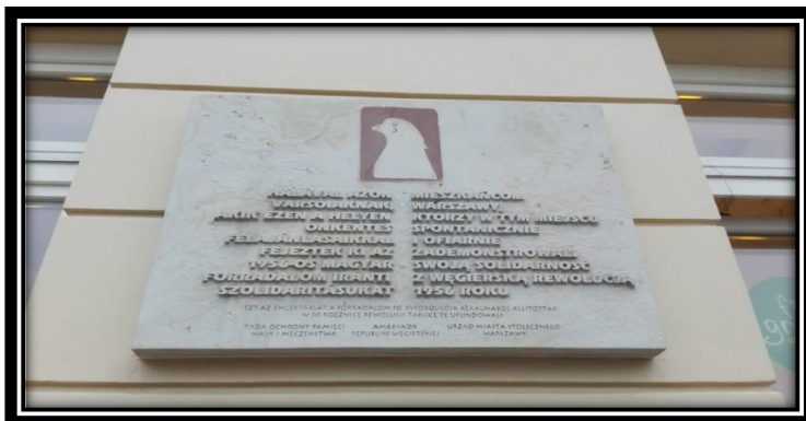
Krakowskie Przedmieście w Warszawie

Treść depeszy świadczy o ogromnej więzi polsko-węgierskiej, pomimo niechlubnego węgiersko-niemieckiego sojuszu.