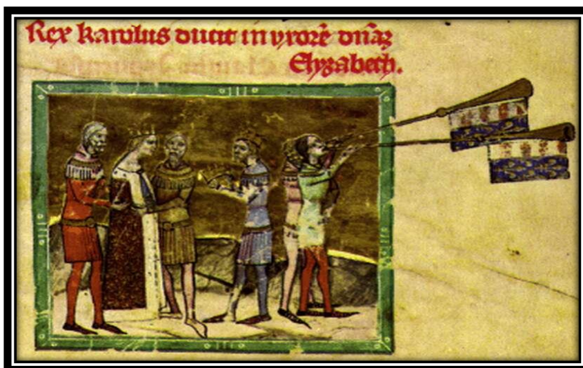
Ślub Elżbiety z Karolem Robertem (miniatura z „Kroniki Ilustrowanej”)

Zarówno Polska jak i Węgry czerpały wzorce głównie z Europy zachodniej i południowej. Z kronik Galla Anonima możemy dowiedzieć się, że Bolesław Krzywousty i Koloman Uczony podpisali w 1086 roku sojusz obronny, zawierając tym samym szyki przeciwko wspólnemu wrogowi. Skutkiem tego sojuszu była m.in. pomoc udzielona Węgrom podczas ataku cesarza niemieckiego. Kolejnym ogniwem spajającym Polskę i Węgry było małżeństwo zawarte pomiędzy Elżbietą Łokietkówną, a pierwszym Andegawenem na węgierskim tronie – Karolem Robertem. Węgrzy wielokrotnie pomagali w tamtym okresie Polakom odpierać ataki nieprzyjaciół np. podczas konfliktu polsko-krzyżackiego.