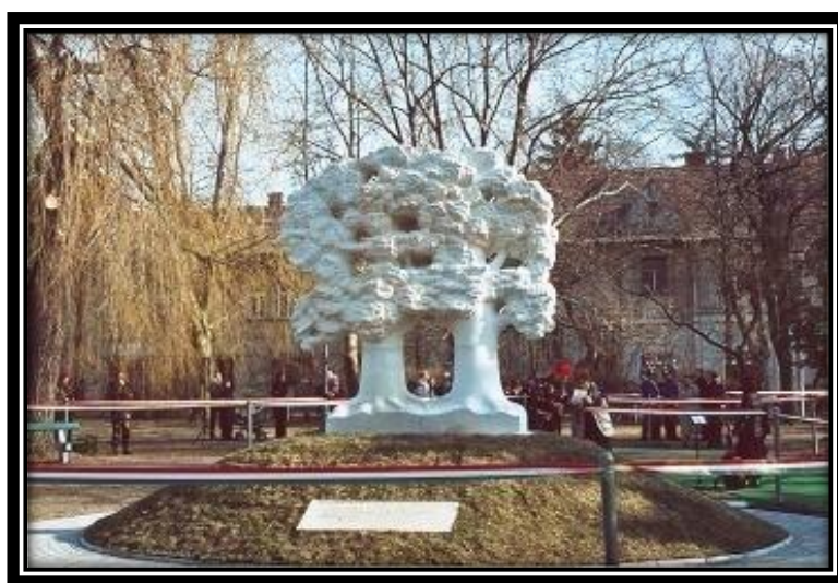
Pomnik przyjaźni polsko-węgierskiej w Győr

Trudno odnaleźć na świecie dwa narody, które darzyłyby się wzajemnie sympatią. Jednak sympatia między Polakami, a Węgrami nie wzięła się znikąd. Oparta została na ponadtysiącletniej historii krajów, których losy krzyżowały się wielokrotnie. Te pasma doświadczeń wpłynęły niewątpliwie na kształtowanie się podobieństw zarówno w polskiej, jak i węgierskiej tożsamości narodowej.